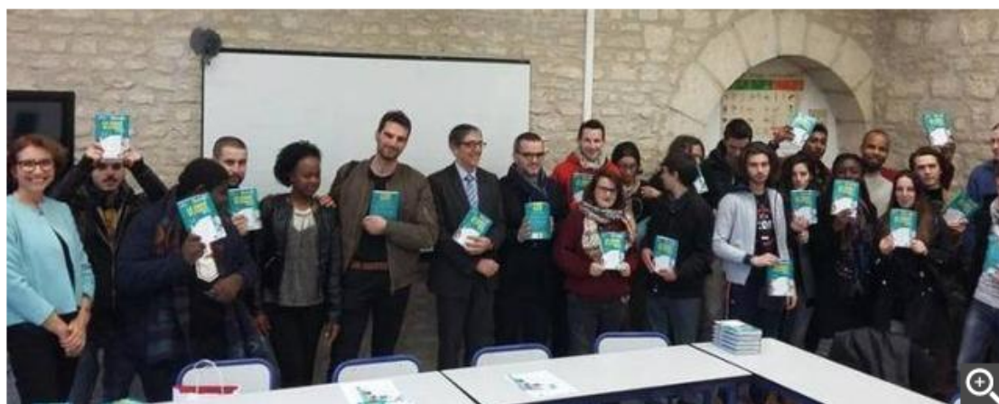
Des codes de la route et des actions choc pour sensibiliser les stagiaires.

Parmi ses actions de sensibilisation auprès de ses sociétaires et du grand public pour réduire le nombre de blessés et tués sur les routes, la Macif a remis à l'École de la 2 e chance ouverte à Niort, une centaine de codes de la route. Pour sensibiliser les stagiaires aux risques routiers, la mutuelle leur a également proposé de tester également le Testochoc, un simulateur de choc frontal destiné à démontrer l'efficacité du port de la ceinture de sécurité et l'importance des distances de sécurité.